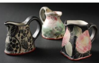
小さなピッチャー