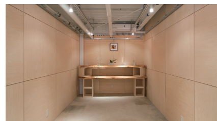
上り口からスペース「桜」を見る。ロフト風の個性的「空・間」