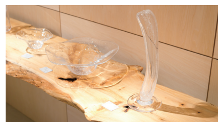
スペース「桜」における展示例。無垢材一枚板の活用モデル