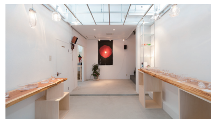
エントランスの階段付近から望む、スペース「桃」および展示例